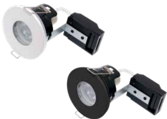
FAST /INOM- OCH UTOMHUS